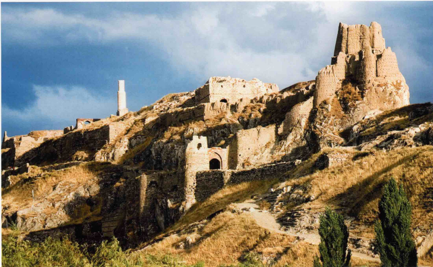
Калето във Ван